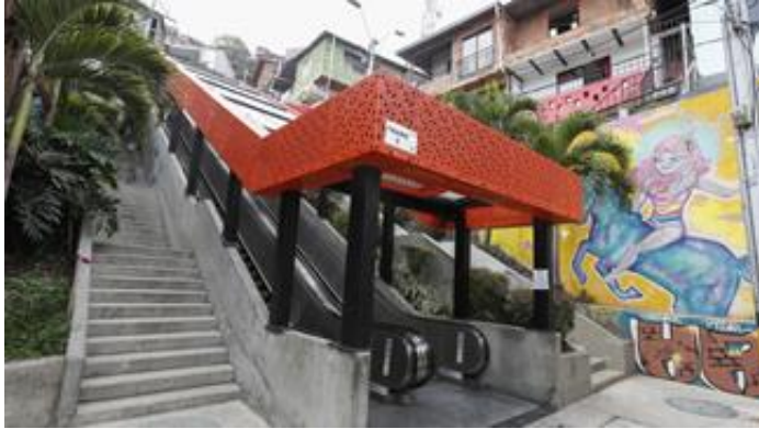
1. COMUNA 13 - MEDELLIN