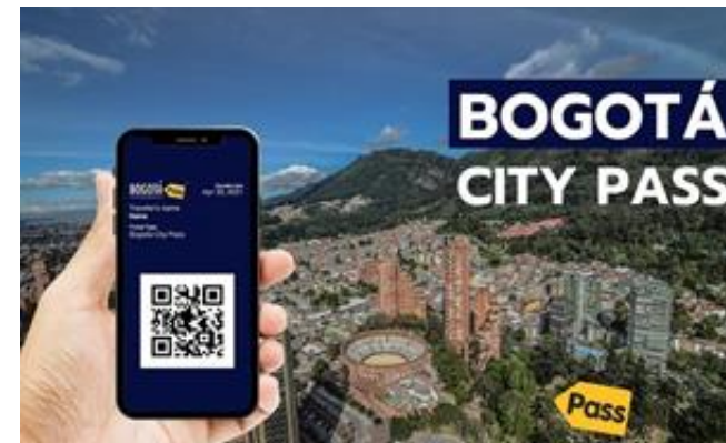
BOGOTÁ CITY PASS