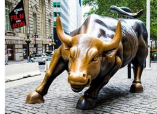
2. WALL STREET - NEW YORK